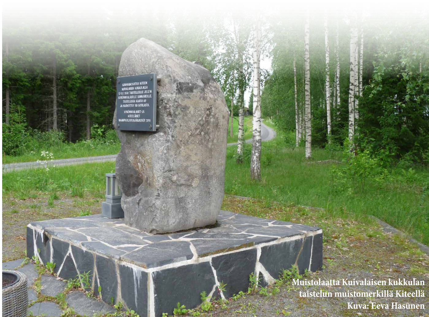
Muistolaatta Kuivalaisen kukkulan taistelun muistomerkillä Kiteellä

Ottakaa yhteyttä suunnitteluryhmään: Matti Pirnes, puh. 040 546 6842, s-posti pirnesmatti@gmail.com tai Teppo Pirnes, puh. 044 769 2473, s-posti teppo@pirnes.net