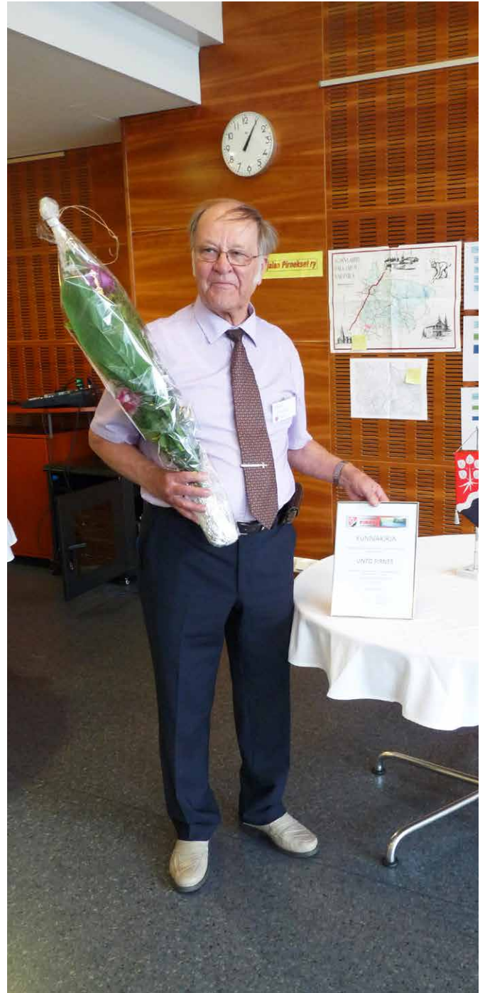
Kunniakirjan ja kukkien kera.