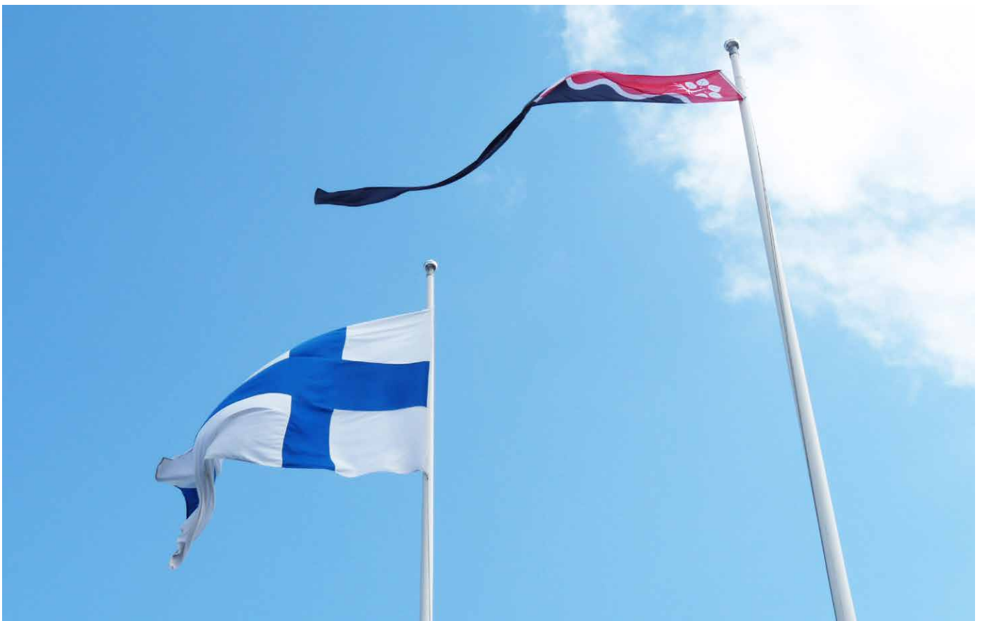
Suomen lippu ja sukuviirimme salossaan.