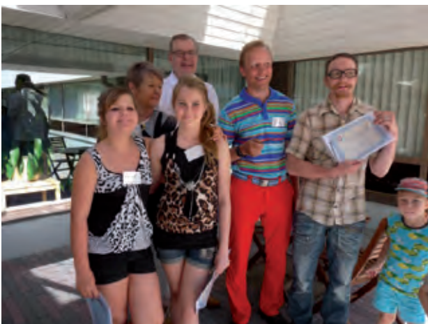
Voittajien on helppo hymyillä...