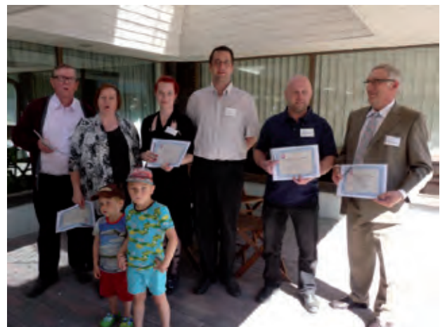
... mutta niin myös hopeajoukkueen!