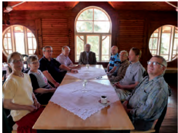
Sukututkimusryhmä koolla 8.7.2015