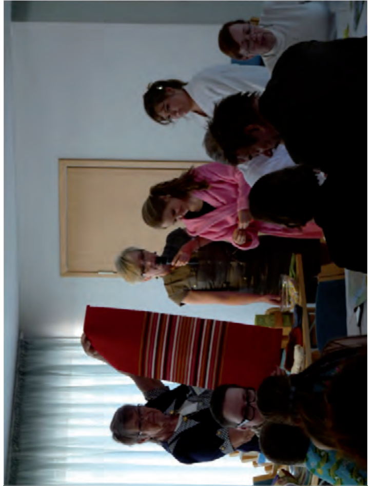
Arpajaiset, aina mielenkiintoinen tapahtuma