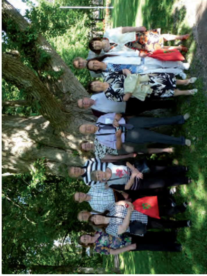
Barokkiryhmä Keisarin poppelin juurella