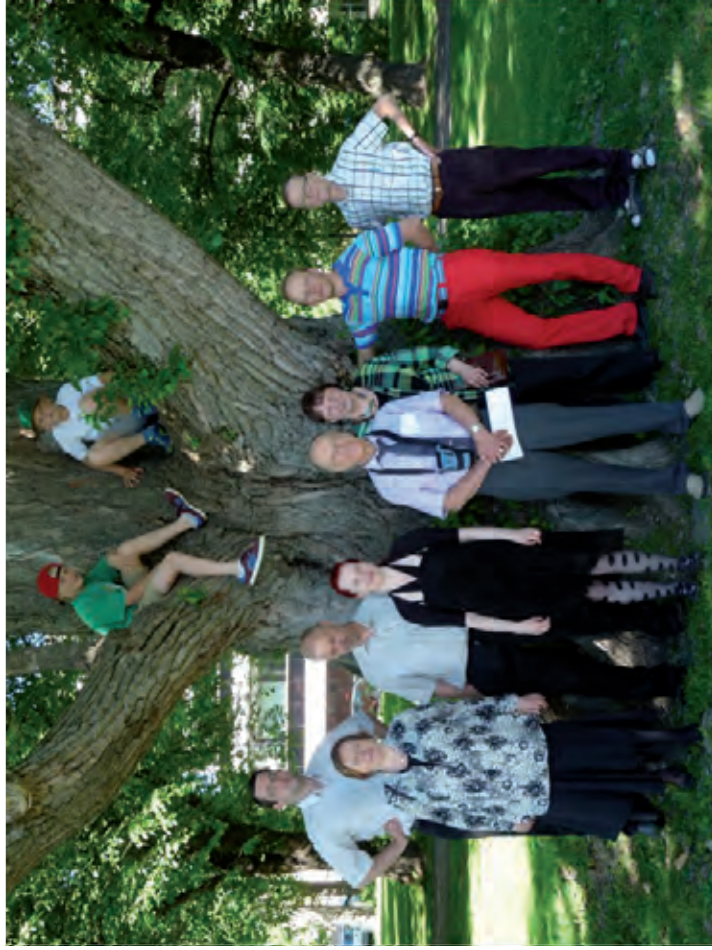
Frisbeegolf-ryhmä Keisarin poppelin juurella