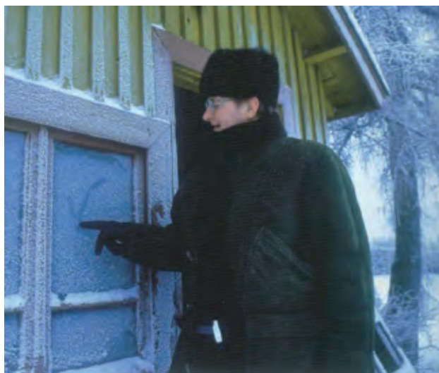
Arkkitehti vaihtoi piirustuslaudan synnyinkotinsa kuistin huuruiseen ikkunaan