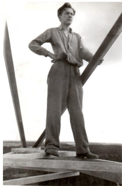
Nuorena linjamiehenä v. 1956