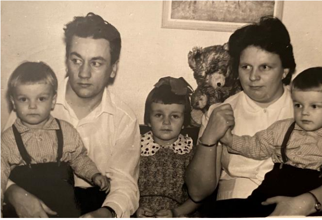
Perhe v. 1966