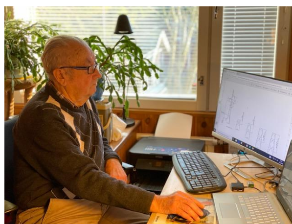
Väiski töissä v. 2020