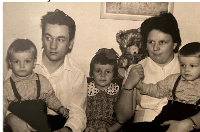
Perhe v. 1966