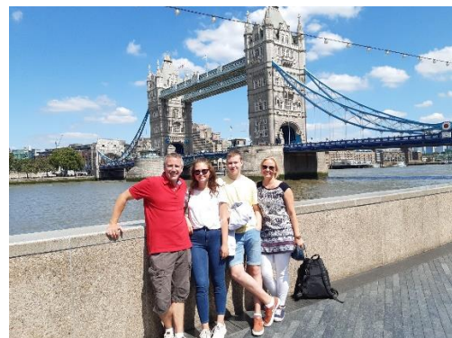
Tower bridge heinäkuu 2019