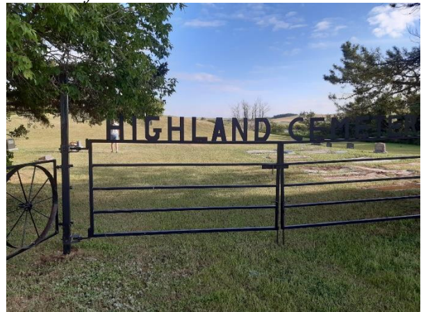
Highland Cemetery is a few kilometres from the homestead of Matti Pirness. Many of Matti and Liisa's children and grandchildren are buried in this cemetery.