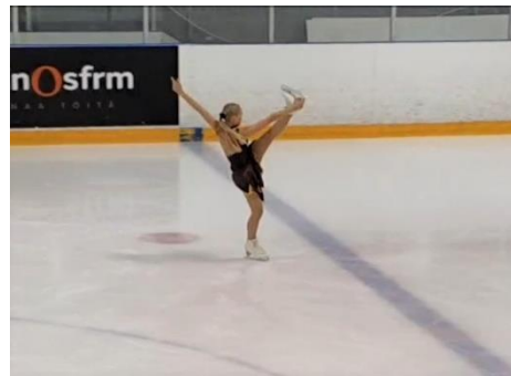
Iris kisoissa marraskuussa 2022