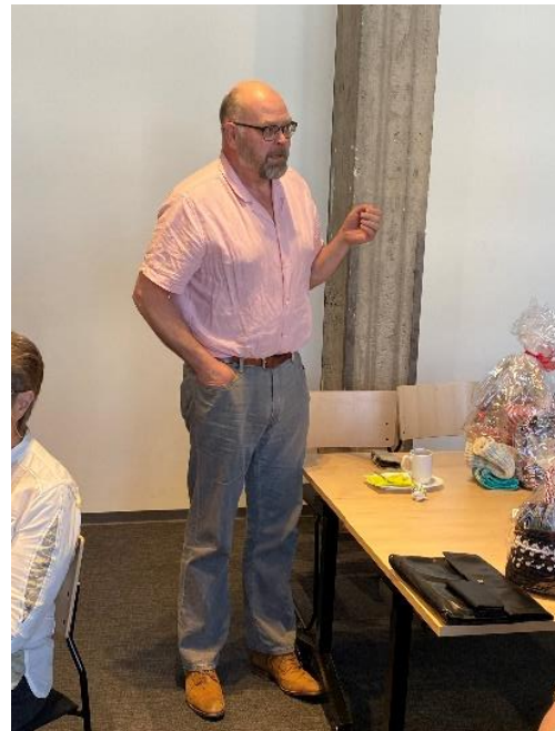
Maury sukukokouksessa Tampereella 2022