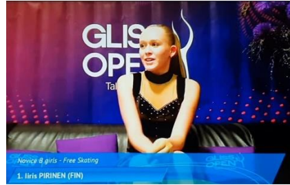
Iris kisoissa tammikuussa 2023 Tallinnassa