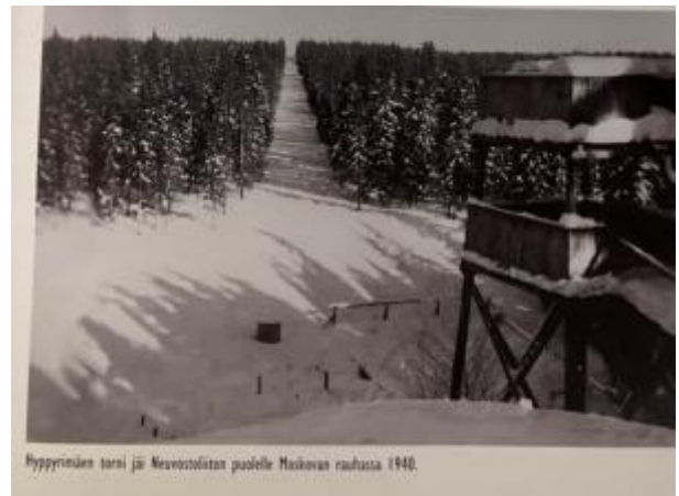
Itäraja-kirjan kuvitusta mainitusta hyppyrinäestä rajalinjalla.

Historiatietoudesta esimerkkinä mainittakoon erityisesti Imatran seutu ja Karjalan Kannak- sen alue Suomen itsenäistymisen jälkeen. Aiemmin niin vilkas vuorovaikutus kaupan- teon, sukulaisuussuhteiden ja muunlaisten liik- kumis- ja vuorovaikutustarpeiden takia muut- tui epäselvissä oloissa mm. salakuljetuksen alueeksi, pakolaisvirroiksi (suuntaan ja toi- seen), suomalaistamishankkeiksi ja muiksi monenkirjaviksi ilmiöiksi. Terijoella oli ainoa rajanylityspaikka maailmansotien välisenä ai- kana.